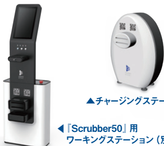
▲チャージングステーション