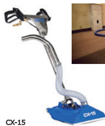
CX-15 カーペットロータリーウォンド